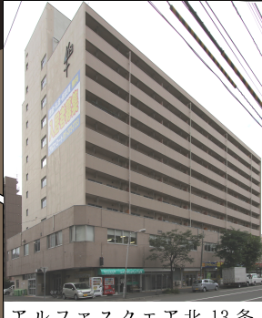
アルファスクエア北13条

※居住者の方がいらっしゃいますので、見学の際は大きな音を立てるなど近隣の方のご迷惑にならないようお願い致します。また、エントランスが3箇所ございますが、内2箇所はテナント用エントランスとなりますのでお気をつけ下さい。